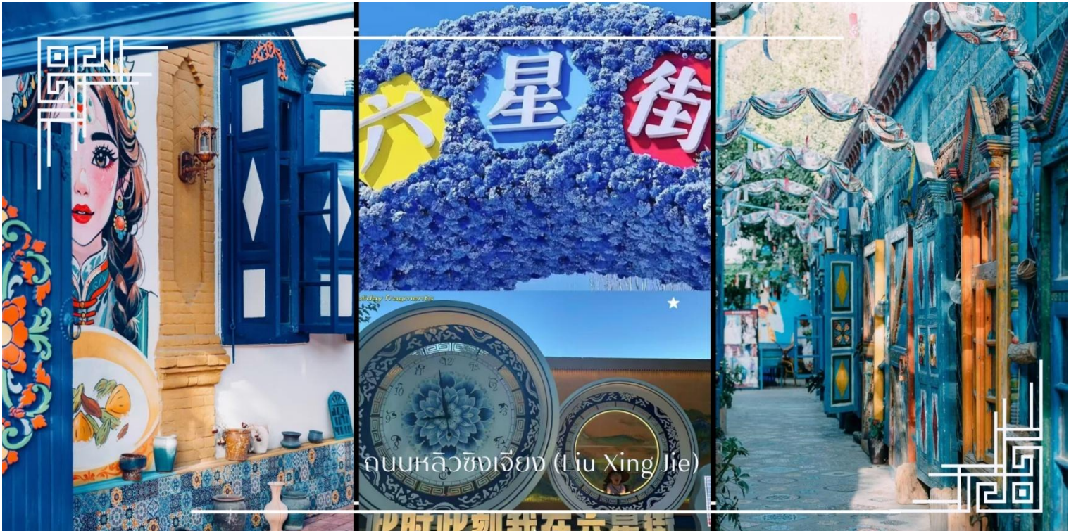
ถนนหลิวซิงเจียง (Liu Xing Jie)

อิสระช้อปปิ้ง ถนนหลิวซิงเจียง (Liu Xing Jie) เมือง อี้หนิง (Yining) ถนนคนเดินที่มีชีวิตชีวาและเต็มไปด้วยสินค้าหลากหลาย เหมาะสำหรับการเดินเล่น ช้อปปิ้ง และสัมผัสบรรยากาศท้องถิ่นอย่างใกล้ชิด สองข้างทางเรียงรายด้วยร้านค้าของฝาก งานหัตถกรรมพื้นเมือง เสื้อผ้า เครื่องประดับ อาหารท้องถิ่น และร้านกาแฟบรรยากาศอบอุ่น โดดเด่นด้วยสถาปัตยกรรมสีสันสดใสที่ผสมผสานกลิ่นอายยุโรปและเอเชียกลางได้อย่างลงตัว