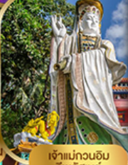
เจ้าแม่กวนอิม ริฟลิสสมัย