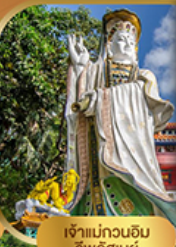
เจ้าแม่กวนอิม รวิไลสมย์