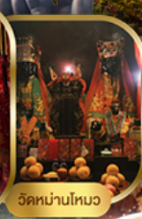
วัดนานโหว