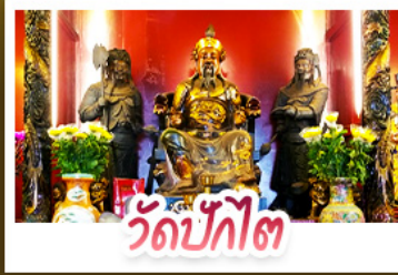
วัดปักโก๊ต