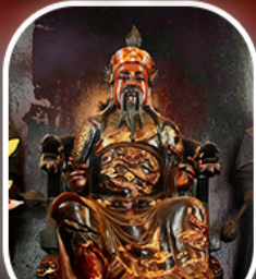
วัดบิกโต