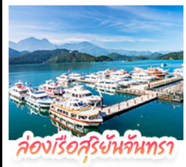
ล่องเรือสุริยันจันทรา

ล่องเรือชมทะเลสาบสุริยันจันทรา (SUN MOON LAKE) ชมเกาะลาลู แวง-วัดสวนกง • อิสระเดินเล่น หมู่บ้านอิต้าซ่า • นั่งรถไฟลิกโมราโน (1 สถานี) สัมผัสบรรยากาศเส้นทางรถไฟสายธรรมชาติ • ตะลุย ไทจงโมโกมารุเกิต แหล่งรวมแฟชั่นและสตรีทฟู้ด • ช้อปปิ้งย่าน ซิเหมินตง (XIMENDING) ถ่ายรูปแลนด์มาร์ค ตึกไทเป 101 • ช้อปปิ้งกังทงที่ MITSUI OUTLET PARK ชมความสวยงามของ อนุสรณ์สถานเจียงไคเช็ค • ฆอพรความรักที่ วัดหลงซาน ชมโศกหินเสี่ยวราซันที่ เย่หลิว • ชมบรรยากาศเมืองเก่าที่ จิวเฟิน