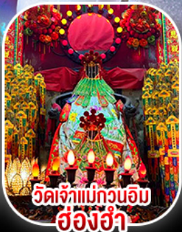
วัดเจ้าแม่กวนอิม ฮ้องฮ่า