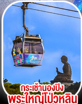
กระเซ้าองบิง พระใหญ่ไ้่วหลิน