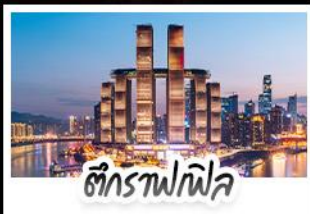
ตึกรูปไฟพล