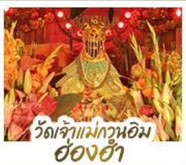
วัดเจ้าแม่กวนอิมอ้งฮ่า