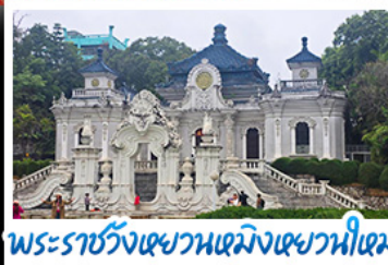
พระราชวังหยวนเหมิงหยวน