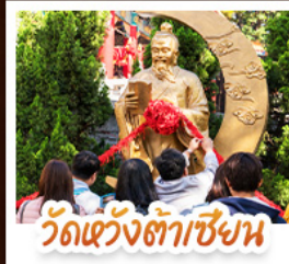
วัดเซว้งต้าเซียง