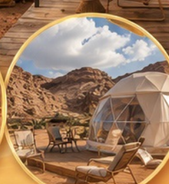
แคมป์กลางทะเลทราย