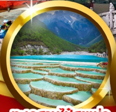
ทะเลสาบไ้สยเห่อ