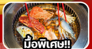
มือพิเศษ!!