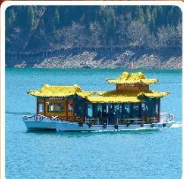
ล่องเรือทะเลสาบเทียนจื่อ