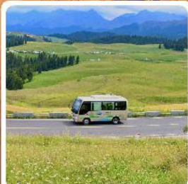
ทุ่งหญ้าเจียนปูลาเค่อ