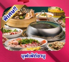
พิเศษ!! บุฟเฟ่ต์ชาบู