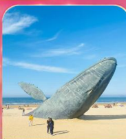
ประติมากรรม"วาฬผู้โดดเดี่ยว"