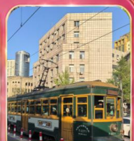
นั่งรถรางไฟฟ้าชมเมือง