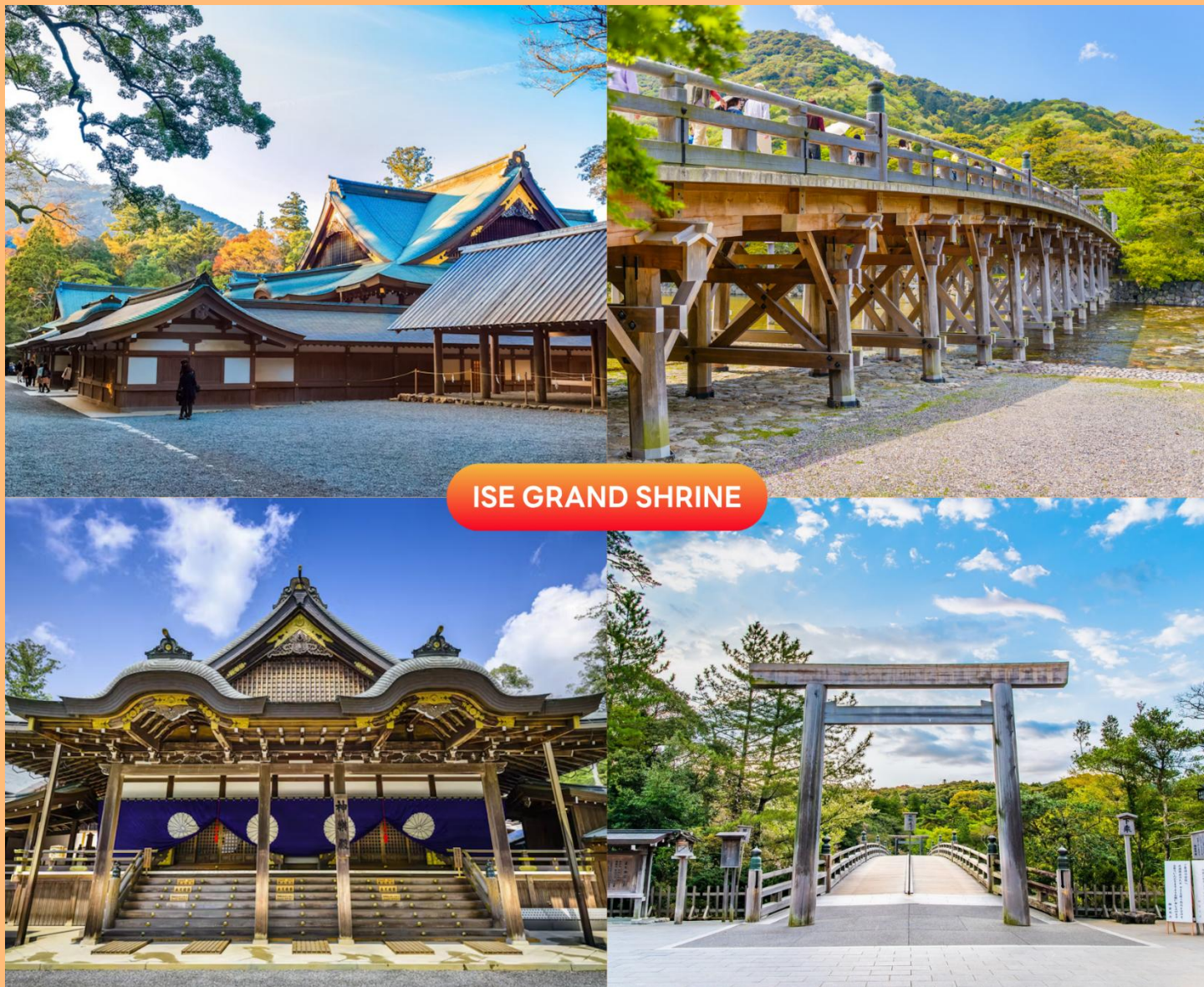
ISE GRAND SHRINE

นำท่านสู่ ศาลเจ้าอิเซะ (Ise Grand Shrine) หนึ่งในศาลเจ้าชินโตที่ศักดิ์สิทธิ์ที่สุดสำหรับชาวญี่ปุ่นตามหลักศาสนาชินโต ธรรมชาติรอบตัวล้วนมีเทพสถิตอยู่ และ ณ ศาลเจ้าอิเซะแห่งนี้เป็นที่ประทับของเทพเจ้าสูงสุด คือ อะมะเตะระสุ โอะมิคะมิ (Amaterasu Omikami) หรือเทพีแห่งแสงอาทิตย์ ต้นกำเนิดของศาลเจ้าอิเซะนั้นไม่ทราบแน่ชัด มีตำนานเล่าว่ากว่าสอง พันปีที่แล้ว เจ้าหญิงองค์หนึ่งได้ออกเดินทางแสวงหาสถานที่เพื่อเป็นที่ประทับของเทพีอะมะเตะระสุ จนได้ยินเสียงบอก ความประสงค์ถึงสถานที่ตั้งศาลเจ้าในปัจจุบัน ( การเปลี่ยนสีของใบไม้ ขึ้นอยู่กับสภาพอากาศเป็นสำคัญ )