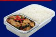
ข้าวทะเลเผาโท