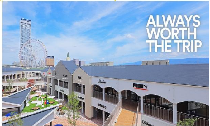
อิสระอาหารกลางวันตามอริยาศัย (รับเงินคืนจากบัตรคูปอง 2,000 เยน)