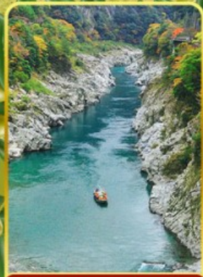
ล่องเรือช่องเขาโอโมเตะ