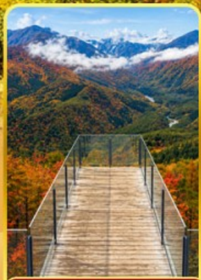
ฮาคุบะอิวาดาเกะ