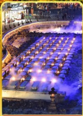
ชมยูซากาเกะ