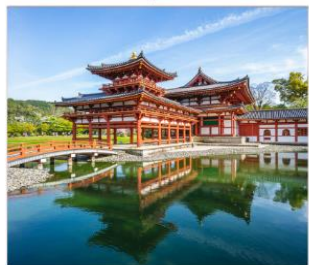
วัดเนียวโตอินและ ถนนซาเงียว