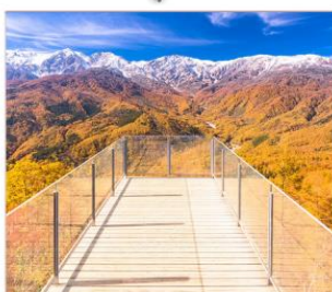
นั่งกระเช้าฮาคูมะ