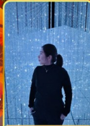
ทีมแอปโตเกียว