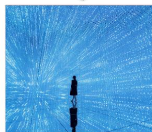
ทีมเล็บแพคนเน็ต