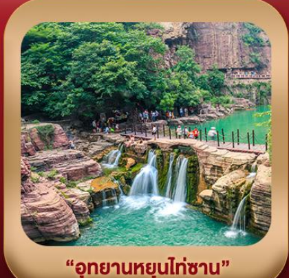
“อุทยานหยุนไต้ซาน”

ชมถ้ำหลงเหมิน มรดกโลกที่เมืองลั่วหยาง • สุสานจิ้นซีฮ่องเต้ • ศาลเจ้ากวนอู วัดเส้าหลิน + ป่าเจดีย์ + ชมโชว์กังฟู • เมืองโบราณลั่วอี้ • อุทยานหยุนไต้ซาน เจดีย์ห่านป่าใหญ่ • ถนนวัฒนธรรมต้าถัง • ถนนคนเดินอิสลาม • จัตุรัสหอระบิง