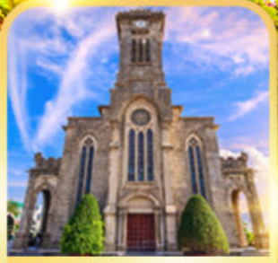
โบสถ์หินญางจาง