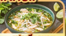
เฟอเวียดนาม