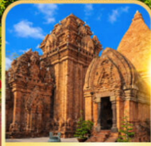
Po Nagar Cham