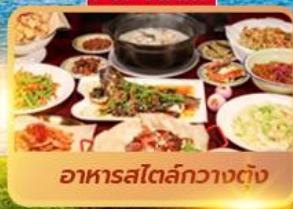
อาหารสตรีทกวางตุ้ง