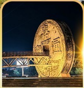
จัตุรัสเหรียญโบราณ