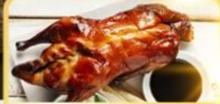
เปิด Four Season