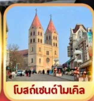
โบสถ์เซ็นต์ไมเคิล