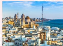
เมืองกาติซ

** พักที่ Puerto Sherry Hotel 4* หรือเทียบเท่า **