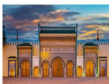
พระราชวังหลวงแห่งเฟซ

** พักที่ Barceló Fès Medina Hotel 4* หรือเทียบเท่า **