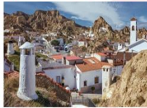
Barrio de Cuevas