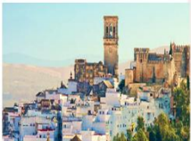
Mirador Plaza del Cabildo