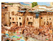
เขตเมืองเก่าเฟซ