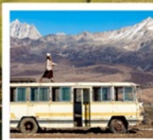
เมืองลอยฟ้าเก๋อตี้ลามู่

ทัวร์คุณธรรม ไม่ลงร้านช้อปปิ้ง ไม่ขายออฟชั่น