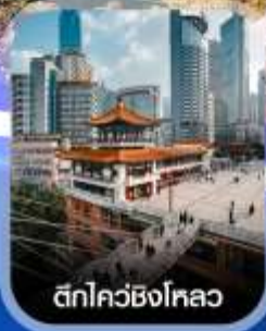
ตึกไควซิงโหลว

✈️ คอนเฟิร์มออกเดินทาง ทุกพีเรียด 2 ท่านขึ้นไป