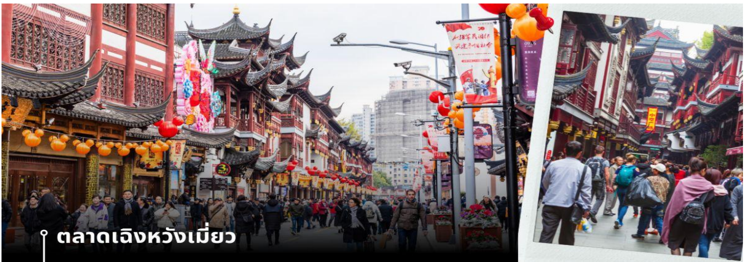
ตลาดเฉิงหวังเหมียว

จากนั้นนำท่านเดินทางสู่ย่าน Xin Tian Di (ซิน เทียน ดี) ย่านฮิปเตอร์ใจกลางนครเชียงใหม่ ที่วัยรุ่นต้องเช็คอิน จนกลายเป็นสถานที่ท่องเที่ยวติดอันดับต้นๆไปแล้ว สำหรับแหล่งช้อปปิ้งแห่งนี้ ไม่แพ้แหล่งช้อปปิ้ง อย่าง ถนนนาคนิง ถนนอยู่เจียง Yu Yuan Bazaar ถือว่าเป็นอีก 1 ไฮไลท์เด็ดของนครเชียงใหม่ก็ได้ เนื่องจากมีเอกลักษณ์ไม่เหมือนใคร สิ่งปลูกสร้างที่ใช้วัสดุบล็อก สถาปัตยกรรมแบบ Shikumen (ซิกเหมิน) การผสมผสานระหว่างสถาปัตยกรรมตะวันตก กับจีนเข้าด้วยกัน ทางเดินหิน กำแพงหิน ประติมากรรม บ้านเมืองเก่าแต่มีการดูแลรักษาอย่างดี เหมาะสำหรับมาเดินแบบ ฮิปๆชิวๆ นำท่านแวะช้อปปิ้ง ตลาดร้อยปีเฉิงหวังเหมียว หรือ ตลาดร้อยปีเชียงใหม่ เป็นตลาดเก่าของผู้ตั้ง เมืองเชียงใหม่ อาคารบ้านเรือนบริเวณนี้เป็นสถาปัตยกรรมโบราณสมัยราชวงศ์หมิงและราชวงศ์ชิง ตกแต่งสไตล์สถาปัตยกรรมแบบ โบราณจีน เก่าแก่กว่าร้อยปี ที่ยังคงความงดงาม ทั้งร้านขายอาหาร ร้านขนมพื้นเมืองอาหารขึ้นชื่อของที่นี่คือ เสี่ยวหลงเปา อันลือชื่อ และยังมีขายของที่ระลึกต่างๆมากมาย