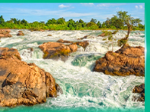
น้ำตกหลี่ผี