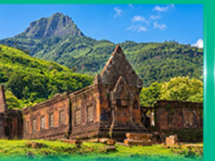
ปราสาทหินวัดพู