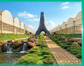
Agro Vege Farm