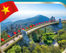
เที่ยวสะพานบ็อกกวงคำ บานาฮิลล์