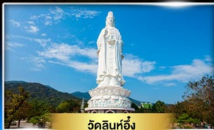
วัดลินห่อ้ง