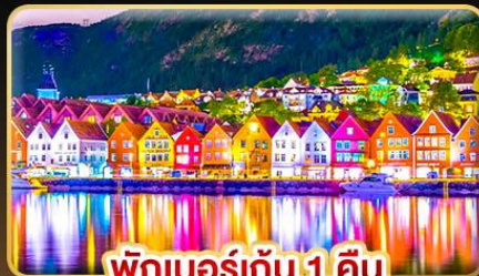
พักเบอร์เกิน 1 คืน