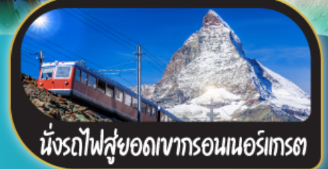
นั่งรถไฟสู่ยอดเขากรอนนอร์เกรต