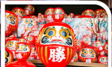
วัดแห่งชัยชนะ-วัดคัตสึโอะจิ(วัดคารุมะ)