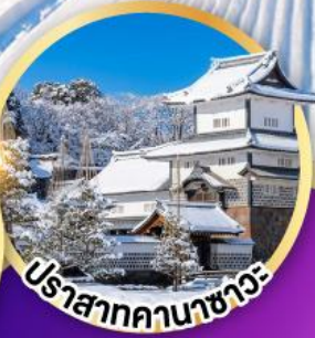
ปราสาทคานาซาวะ

ล่องเรือสำราญโชกาวะ ชมบรรยากาศหิมะและธรรมชาติ สวนเคนโระคุเอ็น 1 ใน 3 สวนที่งดงามที่สุดของญี่ปุ่น