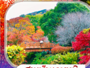
สวนบิวฮาตามิ