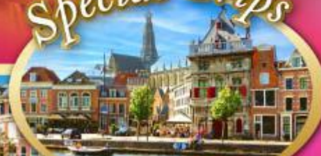
เก็บครบเบเนลักซ์ แะที่ฮาร์เล็ม