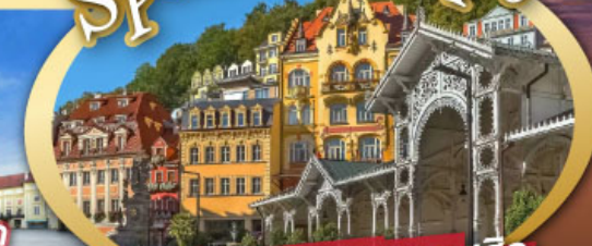
ชมสถาปัตยกรรมคลาสสิก เมือง คาร์โลวี วารี