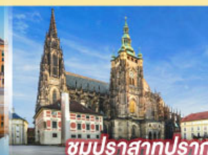
ชมปราสาทปราก