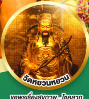
วัดหยวนทวยวน

ขอพรเรื่องสุขภาพ, โชคลาภ ความเจริญก้าวหน้า