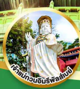
เจ้าแม่กวนอิมรับพลานามัย