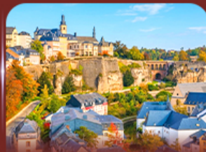
ย่านเมืองเก่า ลักเซมเบิร์ก