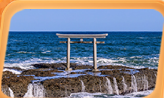
ศาลเจ้าโออาไรโอชิซาทิ

แพคเกจใกล้ชิด "ฟูจิซัง" ที่หมู่บ้านโอชิโนะ อักโท สวนโออิชิปาร์ค ที่เที่ยว Unseen นั่งกระเช้าชมวิวภูเขาสิคุบุะ ศาลเจ้าโออาไรโอชิซาทิ ศาลโทริอิริมทะเล อลังการโบสถ์เปลี่ยนสี น้ำตกเคจอน ศาลเจ้านิกโกโทโชกุ เสริมมงคล วัดพระใหญ่ซึคุ ไดบุคสี ห้ามพลาดคอมแดงยักษ์ วัดอาซากุสะ อิมมอร์ตอลลาดปลาโกโยสุ ภัตตาคารแนว 3D ย่านชิจูกุ ช้อปปิ้งย่านดังชิบูย่า