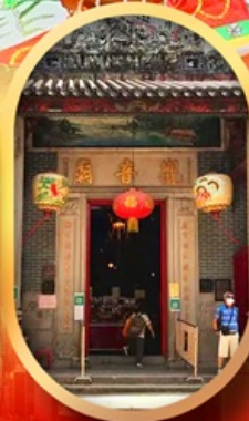
เจ้าแม่กวนอิมสองอ่า