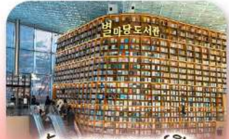
ห้องสมุดสตาร์ฟิว

เก็บทุกไฮไลท์ ในกรุงโซล ตั้งแต่ความงดงามของ พระราชวังเคียงบ็อก ชมวิวสุดอลังการที่ ตึกลีตตเต้ โซลสกาย (รวมค่าลิฟต์ขึ้นตึก) สนุกสุดมันส์ที่ สวนสนุกลือตเต้ เวิร์ล (รวมค่าบัตรเครื่องเล่น) เพลิดเพลินไปกับโลกใต้ทะเล ลือตเต้ อควาเรียม (รวมค่าบัตรเข้าชม) เช็กอินแลนด์มาร์กสุดฮิตอย่างห้องสมุดสตาร์ฟิว โลกอมอลลี เดินเล่นย่านฮิป บรูกลินกาหลี ชองชุง และช้อปปิ้งซัมเมอร์ซอล สุดฟิน ย่านเมียงดงและฮงแด