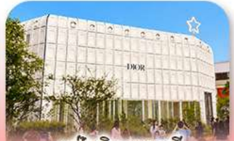
บรูกลินกาหลี