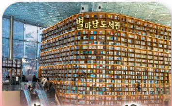
ห้องสมุดสตาร์ฟิลา

เก็บทุกไฮไลท์ ในกรุงโซล ตั้งแต่ความงดงามของ พระราชวังเคียงบ็อก ชมวิวสุดอลังการที่ ตึกลิอิตเต้ โซลสกาย (รวมค่าลิฟต์ขึ้นตึก) สนุกสุดมันส์ที่ สวนสนุกลิตเต้ เวิร์ล (รวมค่าบัตรเครื่องเล่น) เพลิดเพลินไปกับโลกใต้ทะเล ลิตเต้ อควาเรียม (รวมค่าบัตรเข้าชม) เช็กอินแลนด์มาร์กสุดฮิตอย่างห้องสมุดสตาร์ฟิลา โคเอกมอลล์ เดินเล่นย่านฮิป บรูกลินเกาหลี ซองชุง และช้อปปิ้งซัมเมอร์เซล สุดฟิน ย่านเมืองคงและชงแทค