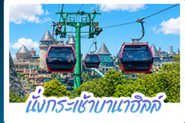
นั่งกระเช้าบานาฮิลล์