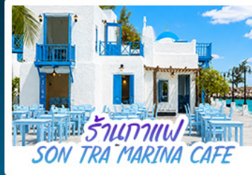
ร้านกาแฟ SON TRA MARINA CAFE