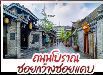
ถนนโบราณ ชอยกว้างชอยแคบ