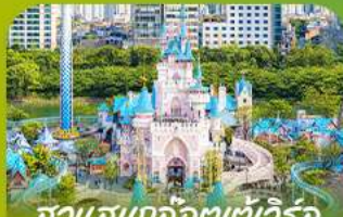
สวนสนุกโลกอเตเวอริล Lotte Adventure World